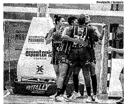
Sampaio Basquete vai decidir classificação para semifinal da LBF

Já o Juventude duela com o Guarany de Sobral (CE), neste sábado (17), às 15h30, no estádio Junco, em Sobral (CE). O Poraquê é o vice-lanterna do grupo A2 com seis pontos, enquanto, o time cearense é o líder com 12 pontos. ■