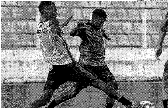
Codó e Nogueira em treino do Moto, no Nhozinho Santos, palco da partida contra o Palmas

Papão do Norte e Tricolor, pressionados, se enfrentam às 15h30, no estádio Nhozinho Santos, pela 8ª rodada da fase de grupos do torneio