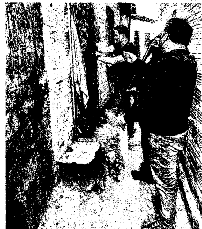
Ação foi realizada pela Polícia Civil na manhã de ontem em São Luís

Colleges de profissão de forçieide Silva já foram assaltados e, em alguns casos, os criminosos levaram, além do dinheiro e o produto da entrega, a motocicleta. "Alguns colegas disseram que há assaltantes muito violentos e levam até mesmo o nosso meio de trabalho", comentou a moto-entregadora.