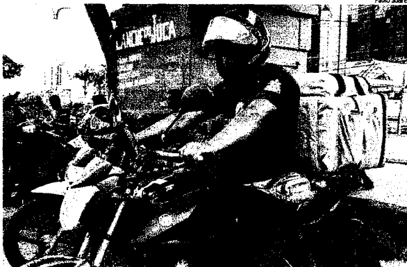
Além de lidar com o dia a dia usando máscaras e álcool em gel, entregadores sofrem assaltos e trotes