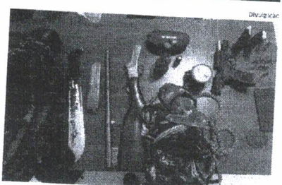
Material apreendido no povoado Inambuzinho, próximo a São Bento