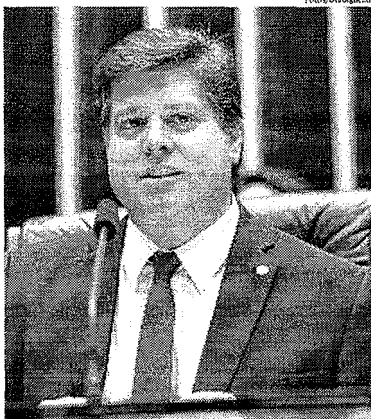
Lira fala em não interferência e Rossi chama atenção para ações do presidente Bolsonaro na eleição para a presidência da Câmara Federal

fala e o que os deputados esperam. Os perfis já estão traçados, ninguém muda voto de ninguém numa altura desta. Cada um tem que terminar com a altivez necessária para saber que no dia 2 de fevereiro vamos precisar estar juntos para votar as pautas que o Brasil precisa".