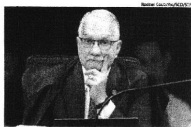
Edson Fachin declarou a incompetência da Justiça Federal do Paraná