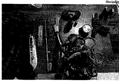
Material apreendido no povoado Inambuzinho, próximo a São Bento

Com relação às estatísticas preventivas, o plano destacou a identificação e mapeamento das áreas de risco da capital; a promoção de ações de instrução básica de Defesa Civil para as comunidades com equipes da Superintendência de Proteção e Defesa Civil (Sudec) e Semusc; o monitoramento constante de 24 horas, por meio de dados dos laboratórios e serviços meteorológicos, Coordenadoria Estadual de Defesa Civil e Sistema de Alerta e Alarme de Desastres da Secretaria Nacional de Defesa Civil.