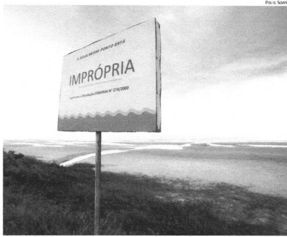
Placa colocada em área de acesso à praia em São Luís indica que local está impróprio para o banho