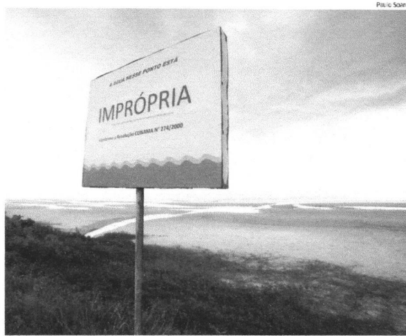
Placa colocada em área de acesso à praia em São Luís indica que local está impróprio para o banho

Segundo a Sema, todos os 21 trechos analisados das praias da Ponta d'Areia, Ponta do Farol, São Marcos, Calhau, Olho d'Água, Meio, Araçagi e Olho de Porco estão em condições de uso pelos banhistas. Apenas, a praia do Manguê Seco, em Raposa, está própria para o banho.