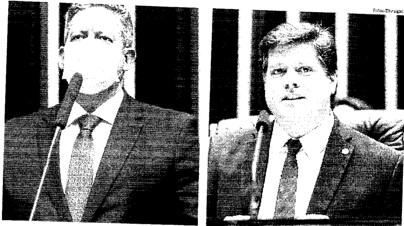
Lira fala em não interferência e Rossi chama atenção para ações do presidente Bolsonaro na eleição para a presidência da Câmara Federal

Lira continuou e disse que não é momento de "baixar o nível da campanha", já que as propostas dos dois candidatos já são conhecidas. "Cada um sabe o que