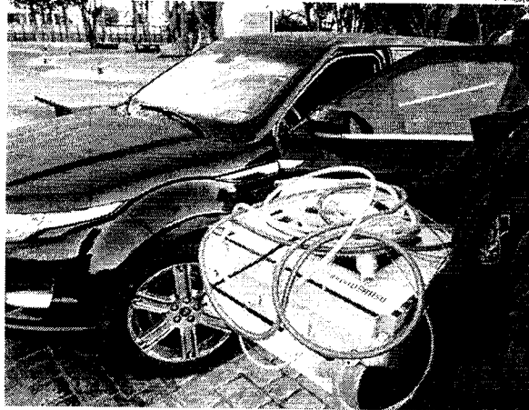
Polícia Civil da Bahia fez a operação e prendeu envolvidos no suposto esquema de compra de respiradores

Edilázio Jr. entrou com ação popular contra Consórcio