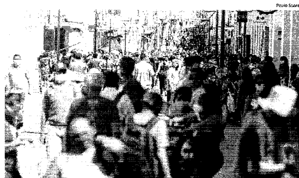
No primeiro dia de reabertura parcial do comércio, a Rua Grande ficou lotada de pessoas que foram às compras

"Estou tentando recuperar o meu prejuízo, pois, fiquei parado por dois