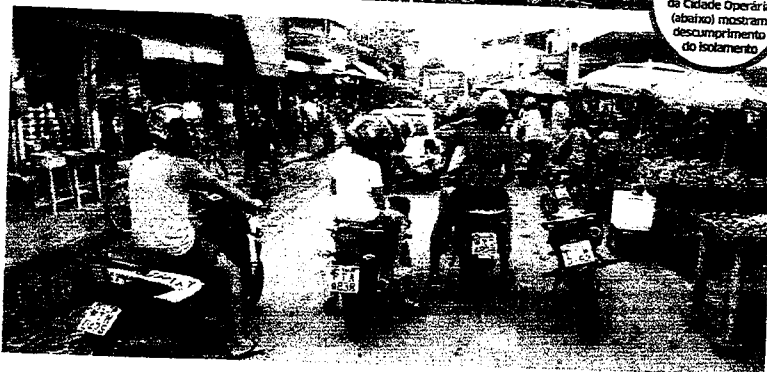
AGLOMERAÇÃO em frente à Caixa (acima) e na feira da Cidade Operária (abaixo) mostram descumprimento do isolamento