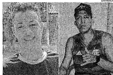
Vítimas de homicídio no São Raimundo; crimes estão sendo apurados

Dois homens foram assassinados, na noite desse sábado (11), no cenário do Conjunto São Raimundo, em São Luís.