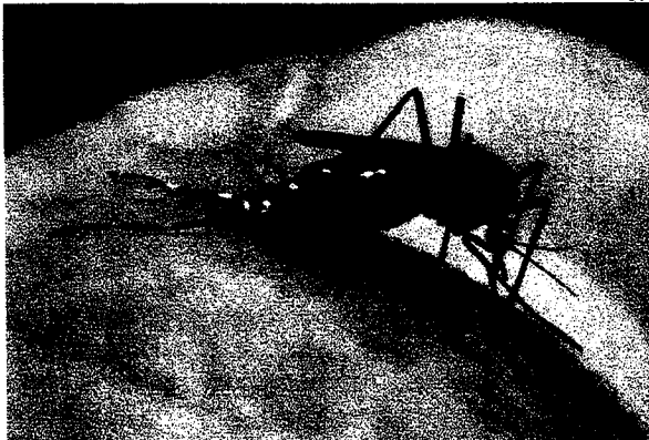
Aedes Aegypti é o mosquito transmissor da dengue e da febre chikungunya e pode ser evitado

Já no caso da chikungunya, os dados apresentam que os números permaneceram baixos neste ano, tendo como pico de infecções nos meses de março e abril, com o registro de 15 e 13 novos infectados, respectivamente. Na última semana epidemiológica analisada não foram registrados novos casos no estado.