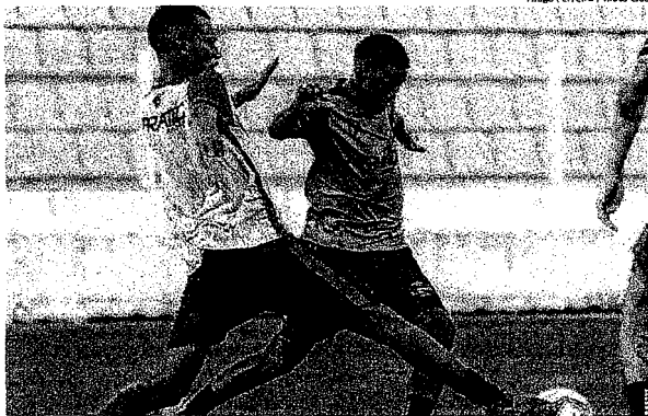
Codd e Nogueira em treino do Moto, no Nhozinho Santos, palco da partida contra o Palmas

Papão do Norte e Tricolor, pressionados, se enfrentam às 15h30, no estádio Nhozinho Santos, pela 8ª rodada da fase de grupos do torneio