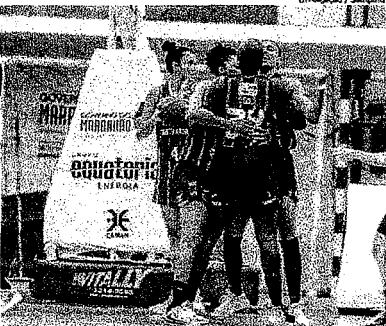
Sampaio Basquete vai decidir classificação para semifinal da LBF