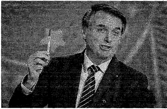
Bolsonaro disse que fundo eleitoral precisa ser reajustado todos os anos e que deve ser conforme a inflação

"O ano retrasado eu sancionei algo parecido, mas que levou-se em conta a inflação do período, e eu não tinha como vetar, alguns queriam que eu vetasse mesmo assim. Se eu vetar, eu estou no curso do artigo 85 da Constituição que fala dos crimes de responsabilidade. Eu tenho que cumprir lei", disse o presidente, em entrevista à Rádio Itatiaia.