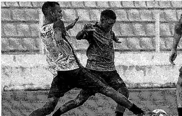
Coddó e Nogueira em treino do Moto, no Nhozinho Santos, palco da partida contra o Palmas

Papão do Norte e Tricolor, pressionados, se enfrentam às 15h30, no estádio Nhozinho Santos, pela 8ª rodada da fase de grupos do torneio