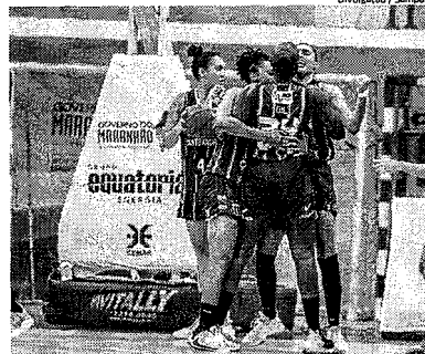
Sampaio Basquete val decidir classificação para semifinal da LBF

Outros maranhenses Além do Moto Club, mais dois times do Maranhão, que também estão no grupo A2 da Série B: Imperatriz e Juventude Sams, entram em campo neste final de semana pela sétima rodada da competição. O Imperatriz enfrenta o Tocantínopolis (TO), neste sábado (17), às 16h, no estádio João Ribeiro, em Tocantínopolis (TO). O Cavala de Açó é o quarto colocado da chave com nove pontos, enquanto, o TEC está em sexto com seis pontos. Já o Juventude duela com o Guarany de Sobral (CE), neste sábado (17), às 15h30, no estádio Junco, em Sobral (CE). O Porangó é o vice-lanterna do grupo A2 com seis pontos, enquanto, o time cearense é o líder com 12 pontos.