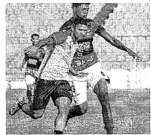
Elenco do Moto Club tem jogo treino diante de Jovem do sub-20