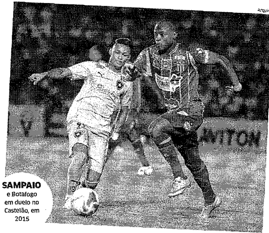
SAMPAIO e Botafogo em duelo no Castelão, em 2015