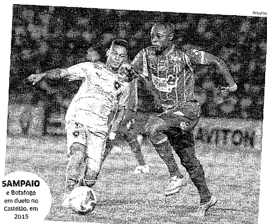
SAMPAIO e Botafogo em duelo no Castelão, em 2015

O Sampaio Corêcia não gosta de boas lembranças das suas últimas experiências em confrontos com o Botafogo. As duas equipes não se enfrentaram neste sábado, 26, às 16h30 (de Brasília), no Estádio Castelão, pela 7ª rodada da Série B do Campeonato Brasileiro. Os últimos encontros entre as equipes ocorreram na Série B de 2015. O Botafogo goleou o Sampaio Corêcia por 3 a 0 no Rio de Janeiro e depois houve empate por 2 a 2, em São Luís (MA). Antes, em 1991, pela Copa do Brasil, o Sampaio Corêcia foi derrotado pelo Botafogo por 2 a 1, em São Luís (MA), após uma vantagem por 1 a 0 na 14ª rodada. Atualmente, as duas equipes não se enfrentam em partidas tão distintas na Série B 2021. O Sampaio Corêcia tem nove pontos, em 11 jogos, e o time carioca, além disso, a Boiúva Querida está invicta em casa e as duas vitórias que obteve na competição foram atuando no Estádio Castelão.