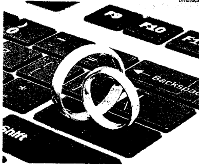
Maranhão é o quarto estado em aumento de separações no país

consensuais passaram de 4.471 no mês de maio para 5.306 em junho deste ano, com crescimento registrado em 24 Estados brasileiros, com destaque para o Amazonas (133%), Piauí (122%), Pernambuco (80%), Maranhão (79%), Acre (71%) Rio de Janeiro (55%) e Bahia (50%). Apenas três unidades federativas não viram crescimento neste período: Amapá, Mato Grosso e Rondônia.