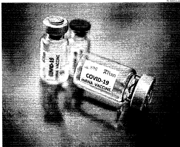
Vacina da Universidade Oxford contra a Covid-19 deve ter 100 milhões de doses para o Brasil

Para o governo, o risco relacionado à eficácia da vacina é considerado "irrisório" pela busca de uma solução efetiva para a manutenção da saúde pública e para a retomada "das atividades econômicas".