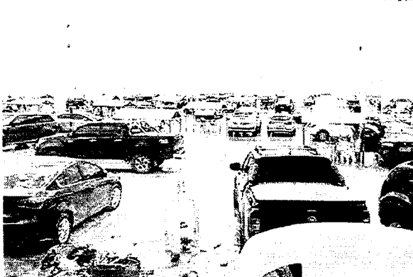
Praia do Meio, na região metropolitana, lotada de banhistas alheios ao risco no fim de semana

Ao lado dos equipamentos, havia muito lixo, também. Um vigilante que trabalha no local disse que vários homens se reuniram ali e passaram a madrugada bebendo cerveja. Todos, segundo ele, estavam sem máscaras de proteção. Em outro ponto, na Praia do Meio, muita sujeira foi encontrada na faixa de areia. Dentro dos residuais, havia muitas garrafas de bebida alcoólica. Além do desprezo ao isolamento social, as pessoas que agem dessa maneira ainda colaboram para a poluição ambiental, uma vez que a água do mar carrega esses materiais e causa impactos devastadores na fauna marinha.