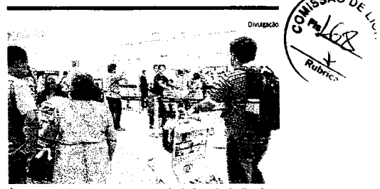
Área de desembarque do aeroporto terá adesivos de sinalização