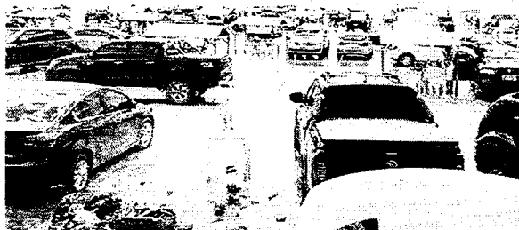
Praia do Meio, na região metropolitana, lotada de banhistas afeiços ao risco no fim de semana

Ao lado dos equipamentos, havia muito lixo, também. Um vigilante que trabalha no local disse que vários homens se reuniram ali e passaram a madrugada bebendo cerveja. Todos, segundo ele, estavam sem máscaras de proteção. Em outro ponto, na Praia do Meio, muita sujeira foi encontrada na fábica de areia. Dentro dos resíduos, havia muitas garrafas de bebida alcoólica. Além do desrespeito ao isolamento social, as pessoas que agem dessa maneira ainda colaboram para a poluição ambiental, uma vez que a água do mar carrega esses materiais e causa impactos devastadores na fauna marinha.