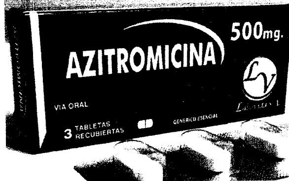
Azitromicina e ivermectina também já não estão com grande venda, apesar da pandemia ter continuidade