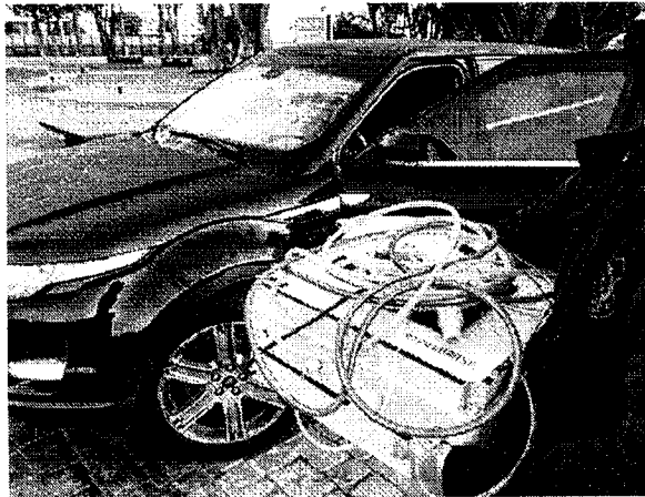
Polícia Civil da Bahia fez a operação e prendeu envolvidos no suposto esquema de compra de respiradores

Edilázio Jr. entrou com ação popular contra Consórcio