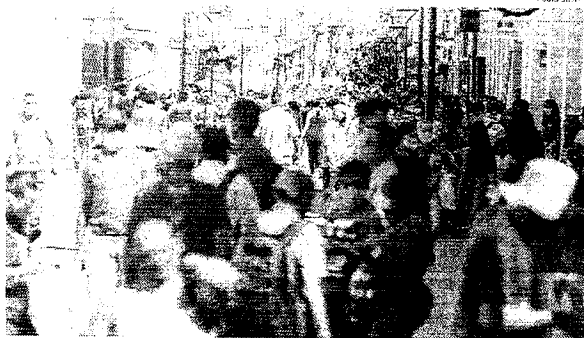
No primeiro dia de reabertura parcial do comércio, a Rua Grande ficou lotada de pessoas que foram às compras.

A movimentação de pessoas foi intensa na Rua Grande, no centro de São Luís, em áreas comerciais de bairro da cidade, na reabertura de pequenos estabelecimentos comerciais, conforme Decreto nº 35.431, assinado pelo governador Helder Barbalho, no último dia 21. O tempo, essas lojas voltaram a funcionar no estado, após mais de dois meses de portas fechadas. O comércio de produtos, roupas e acessórios, além de serviços, também voltou a funcionar. Muitas lojas já estão com filas de clientes esperando para fazer suas compras.