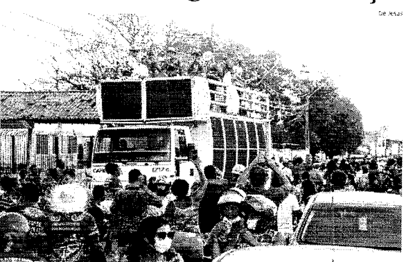
Carreata realizada pelo Boi da Maioba percorreu João Paulo e Filipinho, entre outros bairros da capital

Foi substituída à tradicional Festa de São Marçal, que ocorreria nesta terça-feira (30), a Boi da Maioba realizou uma carreata, ontem, quando também se comemora o Dia Nacional do Bumba Meu Boi e o Dia Municipal do Brincante.