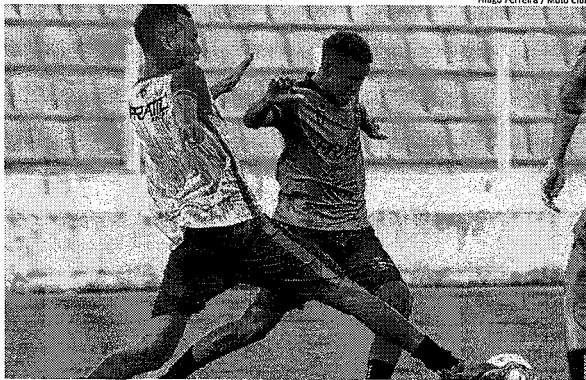
Hiago Ferreira / Moto Club

Papão do Norte e Tricolor, pressionados, se enfrentam às 15h30, no estádio Nhozinho Santos, pela 8ª rodada da fase de grupos do torneio