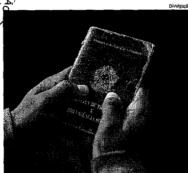
A taxa de desemprego atingiu 13,7% no trimestre móvel de maio-julho

Caso o valor não seja creditado, o contribuinte poderá contatar pessoalmente qualquer agência do BB ou ligar para a Central de Atendimento por meio do telefone 4094-0001 (capitais), 0800-729-0001 (demais localidades) e 0800-729-0088 (telefone especial exclusivo para deficientes auditivos) para agendar o crédito em conta corrente ou poupança, em seu nome, em qualquer banco. ●