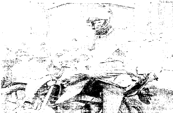
Além de lidar com o dia a dia usando máscaras e álcool em gel, entregadoras sofrem assaltos e trotes

Desde quando se tornou uma medida obrigatória o uso de máscaras e álcool em gel, os motoboys de entrega de alimentos e encomendas da Grande Ilha, em São Luís, passaram a sofrer assaltos e trotes em alguns pontos da cidade. Além disso, muitos entregadores também sofrem com a falta de clientes devido a ações criminosas, como a instalação de bloqueios em pontos estratégicos da cidade.